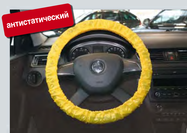
Чехлы для руля, "антистатические", (Арт. D-L 3100) для многократного использования

Защищают электронные устройства от электростатической разрядки. На резинке. Для пассажирских и грузовых автомобилей. Из особенно сильного полиэтилена, с компонентами антистатических материалов.