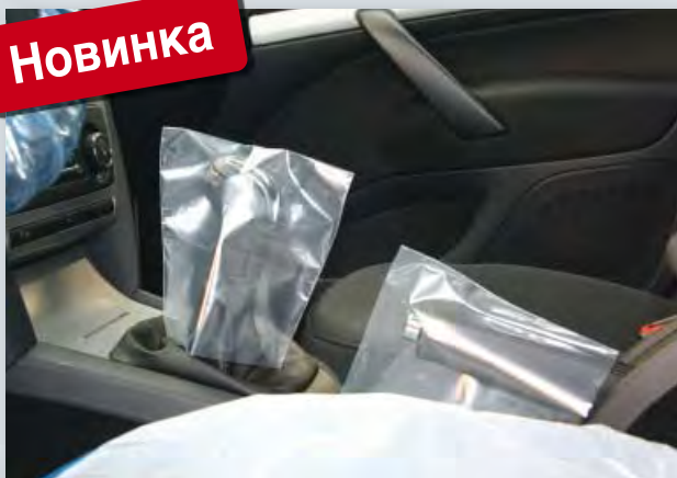
Одноразовый чехол на рычаг переключения передач и стояночный тормоз (Арт. D-SH 2020) из прозрачного полиэтилена, размер: 145 x 160 мм, коробка по 500 шт.