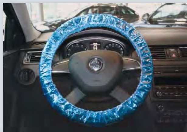
Чехлы для руля, (Арт. D-L 20) для многократного использования

на резинке, для пассажирских автомобилей, из особенно сильного полиэтилена, цвет: синий, 20 шт. в коробке.