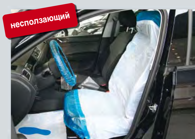
Чехол на сиденье «Optifit»