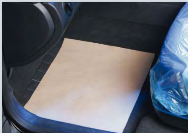
Защита для пола (Арт. D-T 27) из сильной креповой бумаги, размер: 370 x 500 мм, коробка по 500 шт.