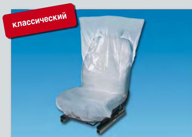
Чехол на сиденье «Classic»