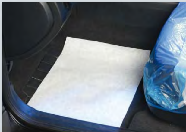
Защита для пола (Арт. D-T 26) из сильной креповой бумаги, размер: 370 x 500 мм, компакт-рулон по 500 шт.