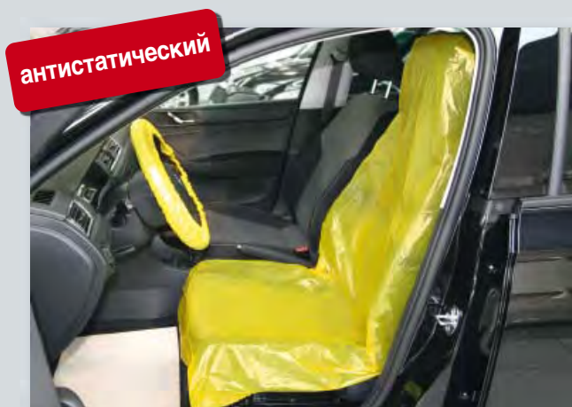
Чехол на сиденье «антистатический» (Арт. D-E 3000)

Защищает электронные устройства от электростатической разрядки, для всех отдельных сидений, из особенно сильного полиэтилена, с компонентами антистатических материалов.