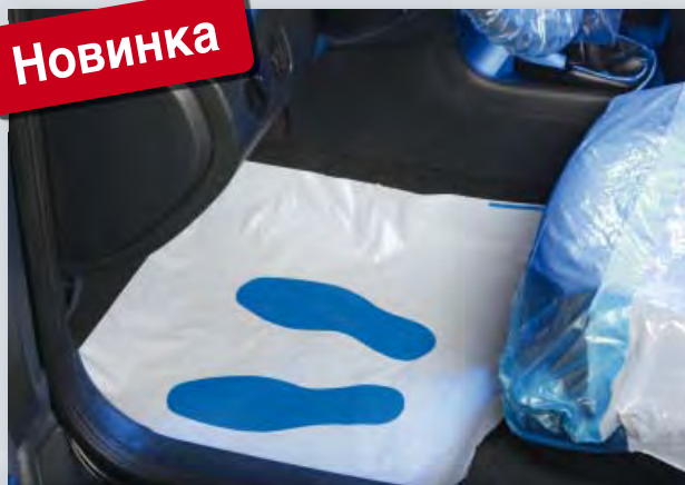
Защита для пола со следом стопы (Арт. D-T 95 F) из белого полиэтилена с печатью, на компакт-рулоне, размер: 550 x 610 мм, компакт-рулон по 500 шт.