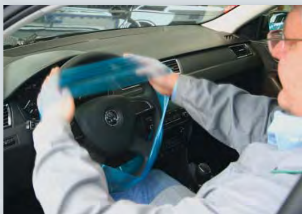
Чехлы для руля, (Арт. D-L 18) для однократного использования

на резинке, для пассажирских автомобилей, из особенно сильного полиэтилена, цвет: синий, 20 шт. в коробке.