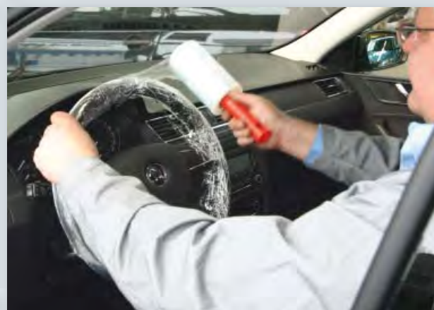
Чехол на руль и рычаг переключения передач, (Арт. D-L 42) для однократного использования

для рулей пассажирских и грузовых автомобилей, полиэтилен, очень растяжимый, 500 шт. на рулоне.