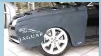
Spatbordbeschermer JAGUAR Art.-Nr. D-JA 140