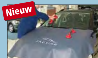
Motorkapafdekking JAGUAR Art.-Nr. D-JA 140-05

Aanbevolen door toonaangevende autofabrikanten.