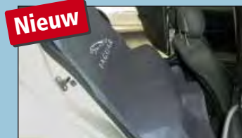
Bescherming achterbank JAGUAR Art.-Nr. D-S 16 JA

Aanbevolen door toonaangevende autofabrikanten.