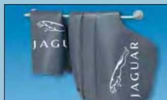
De wandhouder geeft orde Art.-Nr. D-H 99