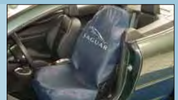
Stoelhoes JAGUAR Art.-Nr. D-S 15 JA